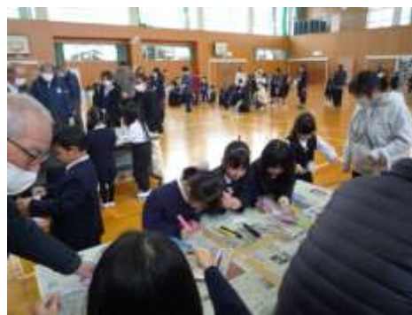
【みんなで楽しんだ三世代交流】