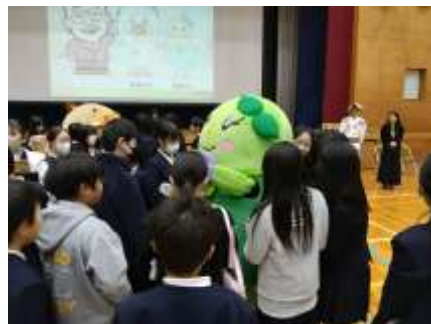
【大人気のまめりん・まるいの】