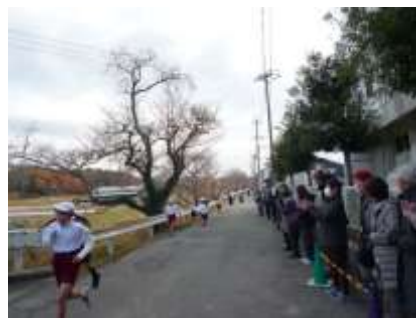
【元気に走る子どもたち】

本番では自分らしく一生懸命に走る素敵な姿がたくさん見られ、みんなで楽しむマラソンフェスティバルとなりました。