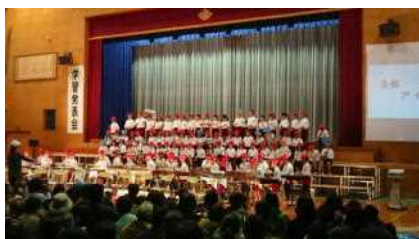
「わくわくくじらぐも」（2年）