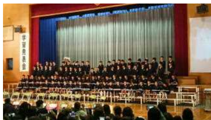
「サラダでげんき」（1年）

11月16日（土）、学習発表会でした。4月からの学びを合唱や合奏で表現したり、お話の世界を語りながら歌ったり、総合的な学習の時間などで学んだことを発表したりと、それぞれ発達段階に応じた学年の特色ある発表を観ていただきました。