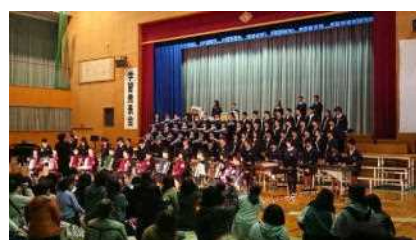
「はばたけ！！平和への道」（6年）