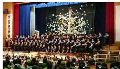
音楽物語「モチモチの木」（3年）