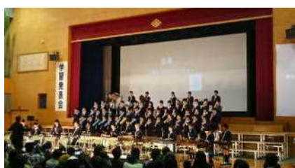
「日本遺産のまち丹波篠山市」（4年）